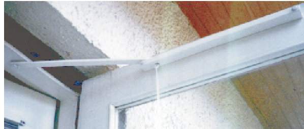
003 parvekkeen oveen asennettuna